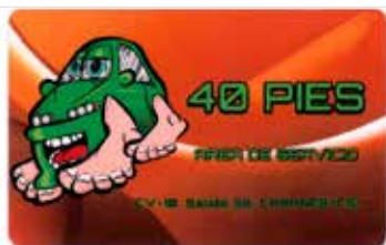
TARJETA AREA DE SERVICIO