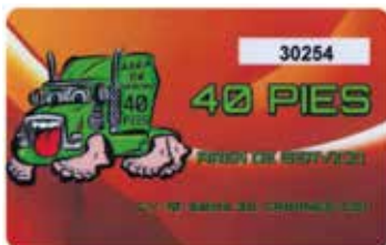
TARJETA AREA DE SERVICIO