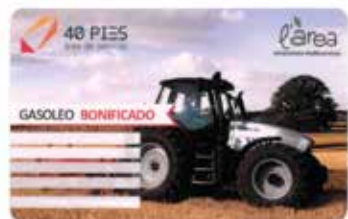
TARJETA GASÓLEO BONIFICADO